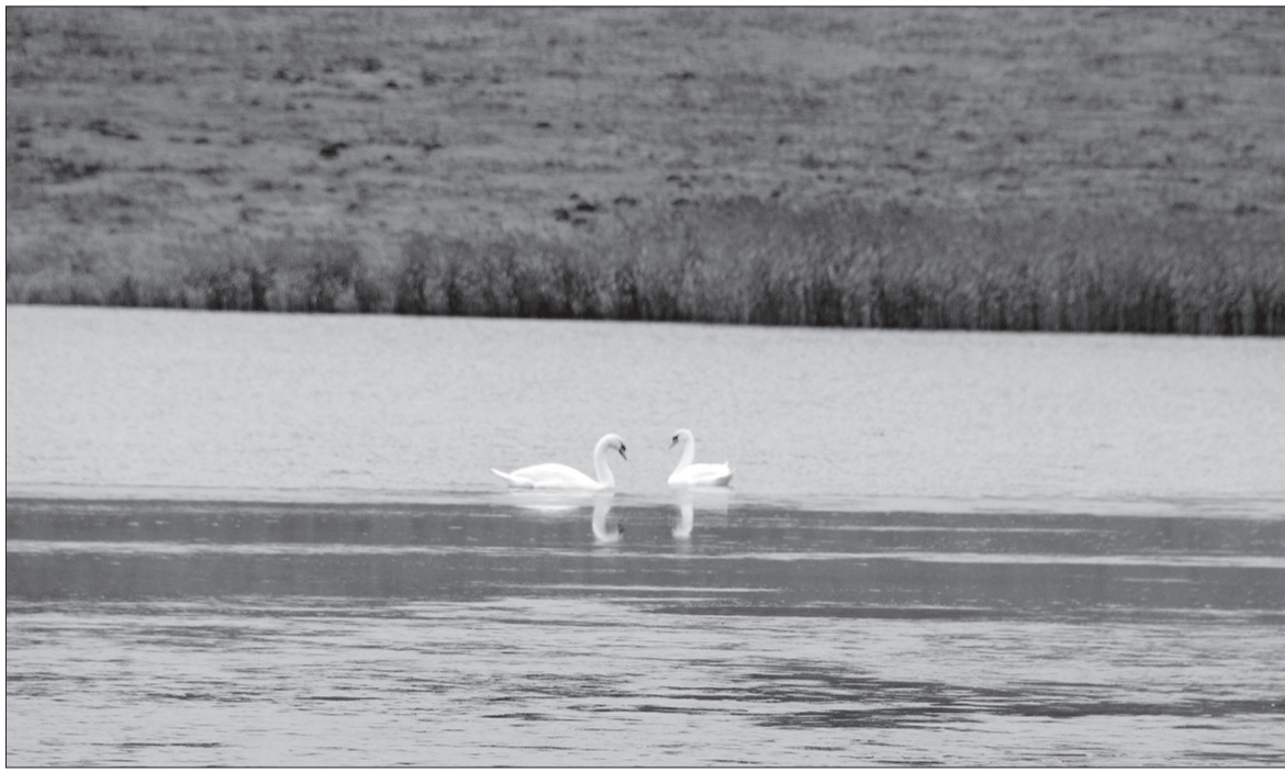
Лебеди плавали далеко от берега, и сфотографировать их крупнее не удалось. Вчера мы еще раз побывали на пруду, там остались только две белые птицы.

В инвестиционной программе планируется строительство детсада в Ашапе, обустройство скважины в Щелканке, строительство газопроводов в Карьево и Медянке, реконструкция ДК в Шляпниках.