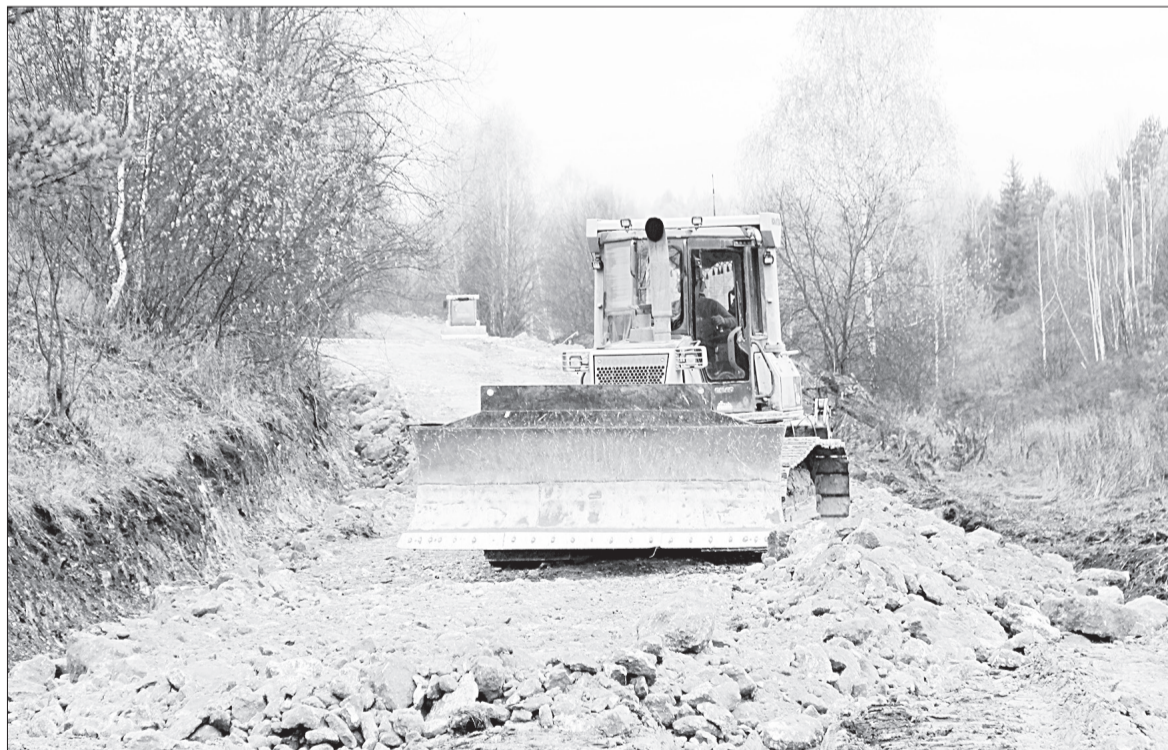
На ремонте дороги за Подзуево задействовано шесть единиц техники.

Идет ремонт объездной дороги за Подзуево к месту будущих очистных сооружений