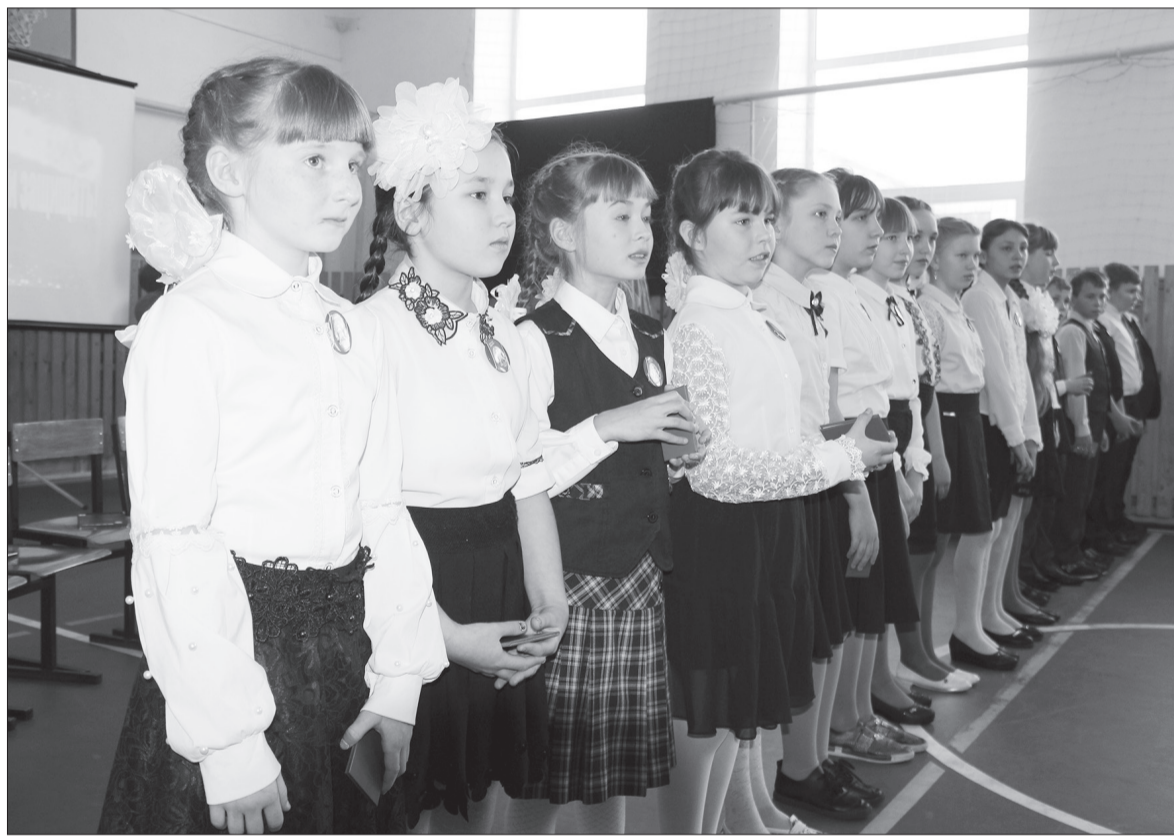
Пятиклассники из Красного Ясыла получили удостоверения юных пожарных.