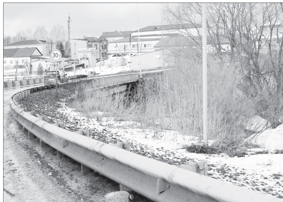
В текущем сезоне обновят мост через Ординку.

В 2022 году запланирован ремонт десяти мостов. В их числе – переходы через реку Усьву в районе