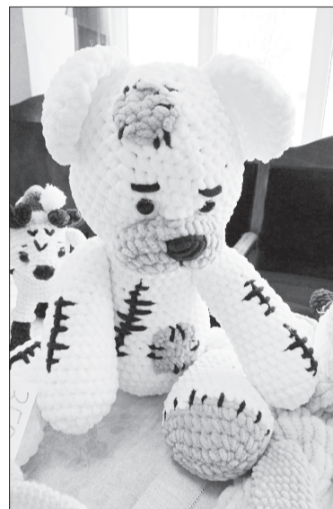
Тянется ниточка, вывязываются петельки. И начинается сказка – теплая, добрая и необычная.

дипломов – Кунгурского художественного училища и Московского института моды, дизайна и технологий. Чуть позднее она окончила курсы аэрографии, рисования скетчей, акварелью и маркерами. А недавно открыла интернет-магазин.