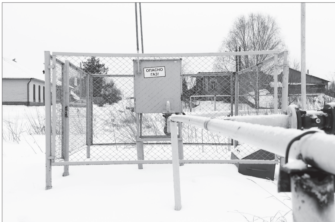
От шкафного регуляторного пункта, где давление газа снижается, голубое топливо по подземному газопроводу идет к потребителю.