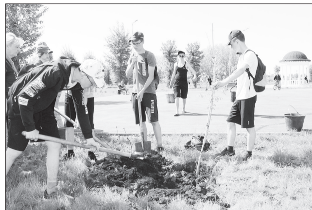
В парке нашлась работа каждому.

И действительно, палящее солнце подгоняло школьников-тружеников поскорей устанавливать хрупкие деревца в спасительные влажные ямки. Не прошло и получаса, как саженцы были на местах. Будут прорастать. Кстати, высаженная прошлой осенью спирея уже в цвету.