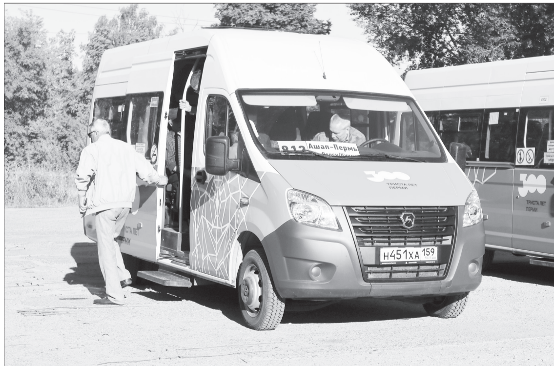
Автобус общением «Ашاپ-Пермь» по маршруту № 812 прибыл на автостанцию Кунгура из минуты в минуту. И по расписанию отправился дальше.