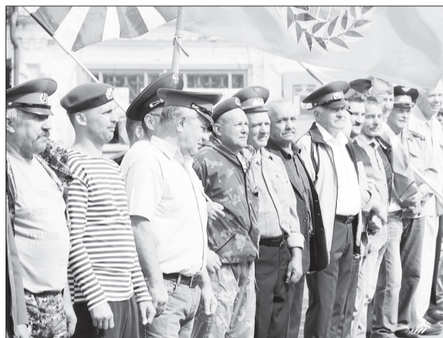
Снова в строю. Кто служил в авиации и обеспечивал безопасность в небе.