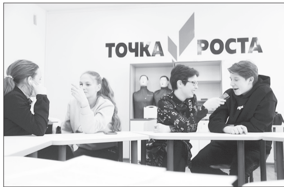
Занятия школьной медиастудии «КИНО-ОТАКУ» в «Точке роста» Ординской школы.

СПРАВКА. «Точки роста» повышают качество образования в школах сёл и малых городов. Центры работают в естественно-научной и технологической направленности. Первая «Точка роста» на базе Ординской школы открылась в 2020 году. Здесь оснащены кабинеты информатики, технологии и ОБЖ, шахматно-шашечная зона. Работает медиастудия «КИНО-ОТАКУ» и кружок робототехники.