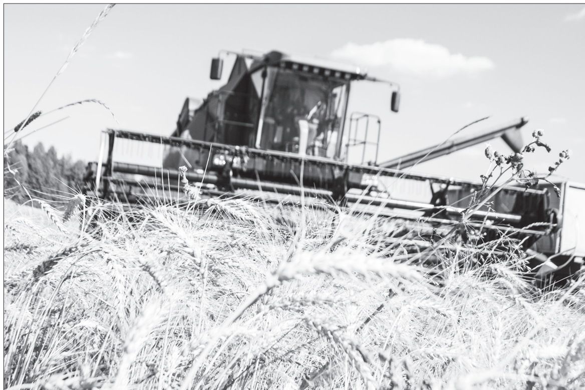
Жатва на полях ООО «Карьево» в августе. Посевные площади под зерновыми 1300 га.

Что собрали с полей ординские аграрии. И чем прирастают