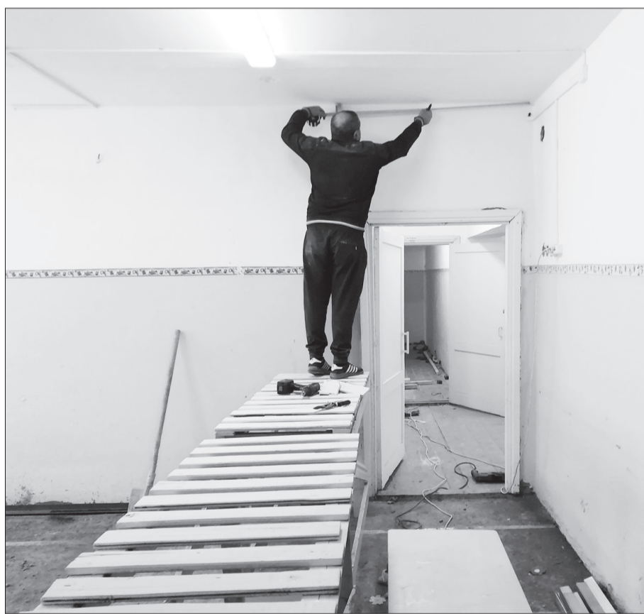
Осенью в сосновском здании проверили систему отопления, отремонтировали крышу, сейчас идут работы внутри.

Здание в Сосновке ремонтируют для школы-интерната