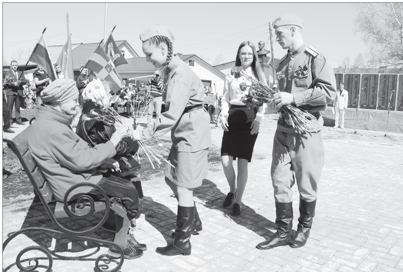
Почётными гостями праздника Победы стали труженики тыла, вдовы участников Великой Отечественной войны и дети войны. Лично присутствовать на торжестве в честь 77-й годовщины Победы смогли десять приглашённых.

Праздник 9 Мая в Ординском округе. Продолжение темы на 2 стр.