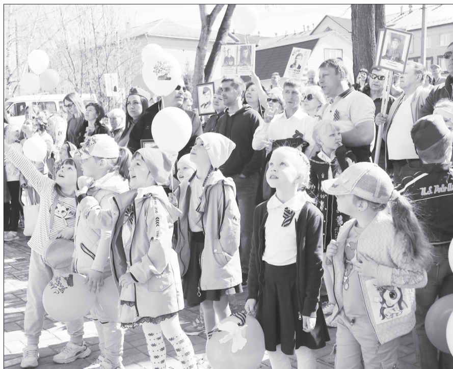
Малыши на празднике соответственно его моментам были то торжественные и тихие, то непоседливые и веселые. Пели и пританцовывали, а в минуту молчания серьезно вытягивались по струнке.