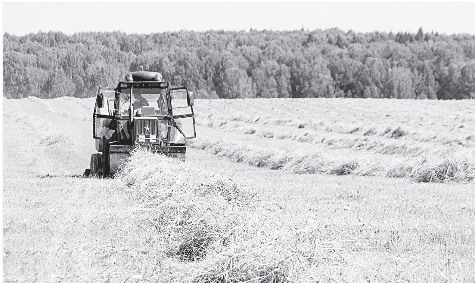
Рулонный пресс-подборщик прессует сухое сено.

«Ленинцы» планируют запастись кормами в достатке и впрок